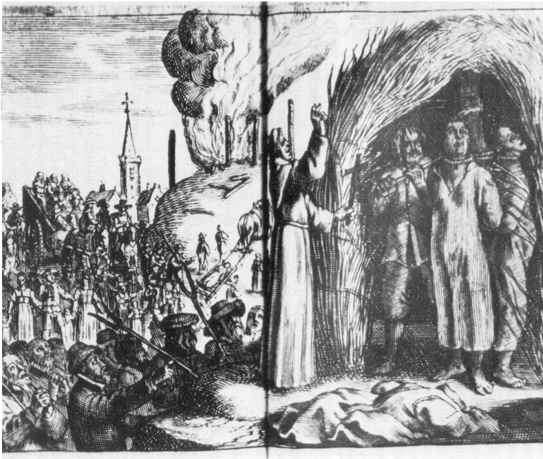
Feuertod in der Verbrennungshütte

Förderung der jeweiligen Gerichtsherren bedurfte, Hexenprozesse überhaupt zuzulassen. Im Herrschaftsbereich des Trierer Kurfürsten war dies die Regierungszeit der Kurfürsten Johann VII. von Schönenberg (1525-1599) zwischen 1581 und 1599 sowie Philipp Christoph von Sötern (1567-1652) zwischen 1623 und 1652. Bereits der Nachfolger von Sötterns, Karl Kaspar von der Leyen (1618-1676), der zwischen 1652 und 1676 als Kurfürst regierte, verbot um 1653/1654 im Erzstift Trier die Hexenprozesse kategorisch. 11) Dies war für die Ochtendungen Hexenverbrennungen des Jahres 1652 allerdings mindestens ein Jahr zu spät.