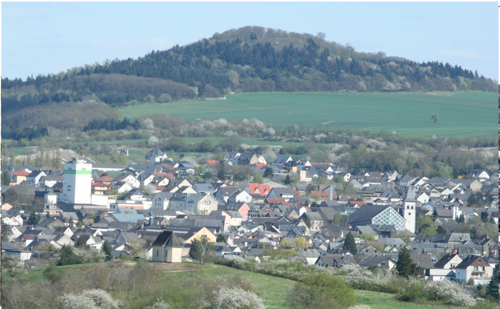
Ochtendung mit Schönstattkapelle und Karmelenberg

In diesen noch wenig in sich gefestigten Territorien schien es zum traurigen Ehrgeiz der Herrschenden zu gehören, sich gerade bei den Hexenprozessen als unnachgiebige Gerichtsherren zu beweisen. 10) Die unterschiedlichen Zeiten der Verfolgungswellen belegen auch, dass es der Billigung oder